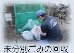
未分別ごみの回収

「生ごみ」と言っても、いろいろな理由で捨てられています。魚の骨の太い部分や、玉ねぎの皮など、食べられなくて捨てるもののほかに、本当は食べられるのに捨てているもの、そして、手をつかずに捨てられてしまう食品の事を「食品ロス」と言います。