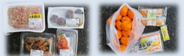
燃やすごみの中から見つかった手つかず食品の数々。