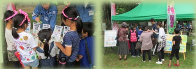
分別ゲームで楽しくお勉強。皆さんの関心の高さがすごい！

5月13日(日)、今にも雨が降り出しそうな曇り空の下、北八朔公園にて「グリーンフェスタ in 八朔 2018」が開催されました。資源循環局緑事務所は、緑区資源化推進担当と共同で「ごみと資源の出張相談ブース」を開設しました。