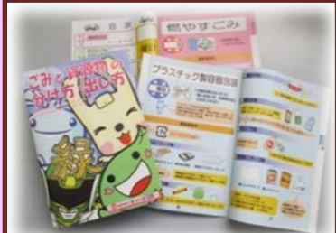
緑区オリジナル版