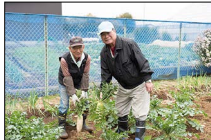
六ツ川野外サロン（南区） 農作業を通じて楽しみながらお互いに 見守り合う関係づくりが生まれる。