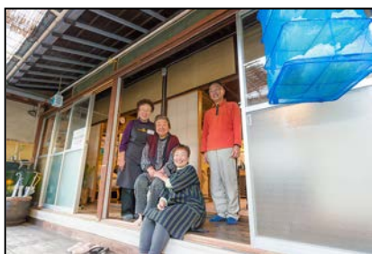
ジュピのえんがわ（金沢区） 駄菓子屋と縁側のあるサロンの併設で、 子供と大人と一緒に過ごせる交流の場に。