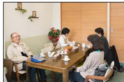
コミュニティだんだん（泉区） 地域の方が主役となって 生き生きと活躍できる場を提供。