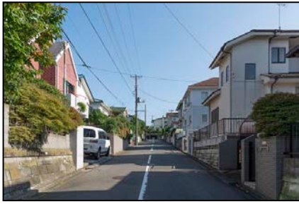
西柴団地自治会地区建築協定運営委員会（金沢区） まちの変化に対応しつつ、住環境を守るため 建築協定の制限を変更。