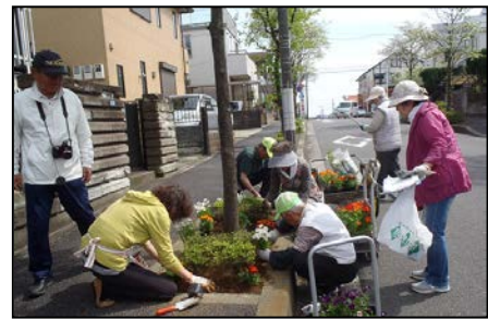
第九緑の会（旭区） 緑と花の活動を通じてまちも美しく、 地域のつながりも広がる。