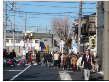
鶴見区市場西中町まちづくり協議会（鶴見区） 地域の地道な活動で歩道の拡幅、広場づくりなど 防災面で多くの成果を上げる。