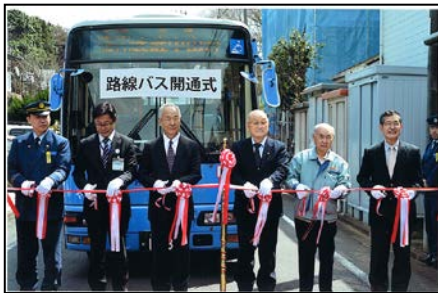
武蔵中山台交通対策委員会（緑区） 地域の合意形成を丁寧に図りバス路線を開通、 まちも活性化。