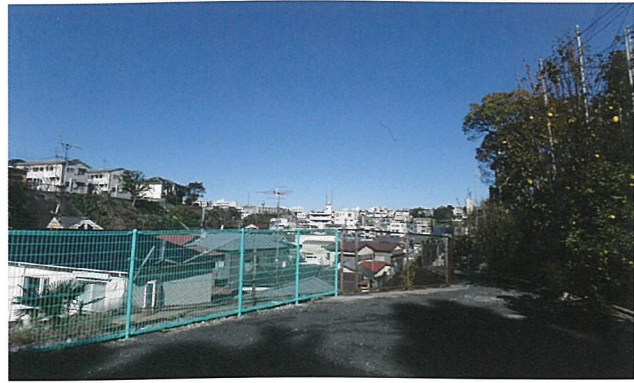
広場からの眺めは良好

防災広場は、災害時には地域防災活動拠点として活用され、平常時には地域のコミュニティづくりの場所として役立ちます。今では中学生が夕暮れ時におしゃべりをする場となっているなど、住民の憩いの場所になりつつあります。