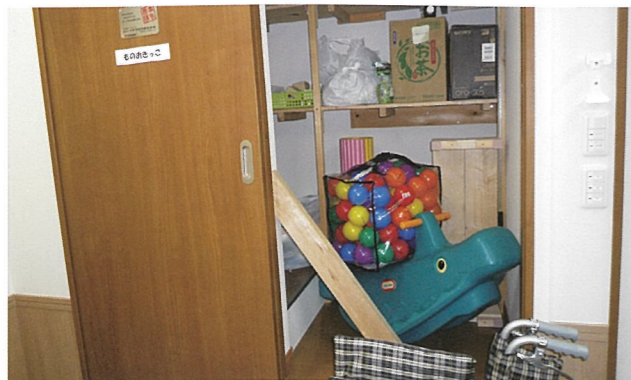
ものおきこと名付けられた収納庫