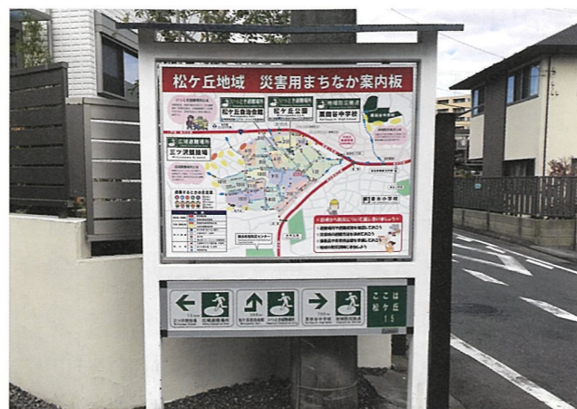
災害用まちなか案内板

いう意味をこめた「近助」を実現するために、あいさつ運動や自治会館での催しを実施して、多世代の交流を促してきました。加えて、住宅の一角にまちかどベンチを設置して、コミュニケーションの活性化をはかるなど、近隣の人たちができるだけ顔見知りになり、次のアクションに結び付けることができるような取り組みをしています。