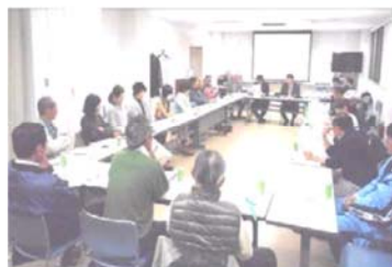
せやまるふれあい館