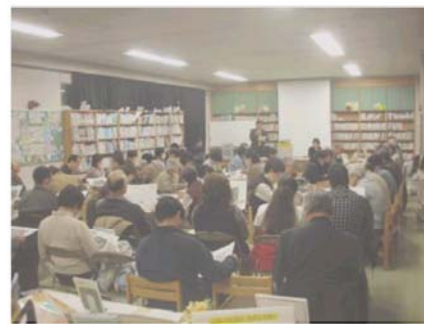
説明会の様子（瀬谷小学校）