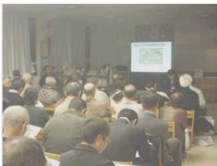
説明会の様子（二つ橋小学校）