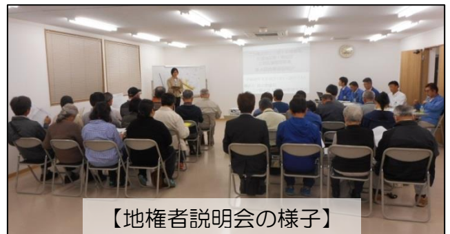
【地権者説明会の様子】

また、以下の通り第1期地区地権者の皆さまを対象に「 第5回地権者説明会 」の開催を予定しています。詳細については後日送付する「開催通知」をご覧ください。