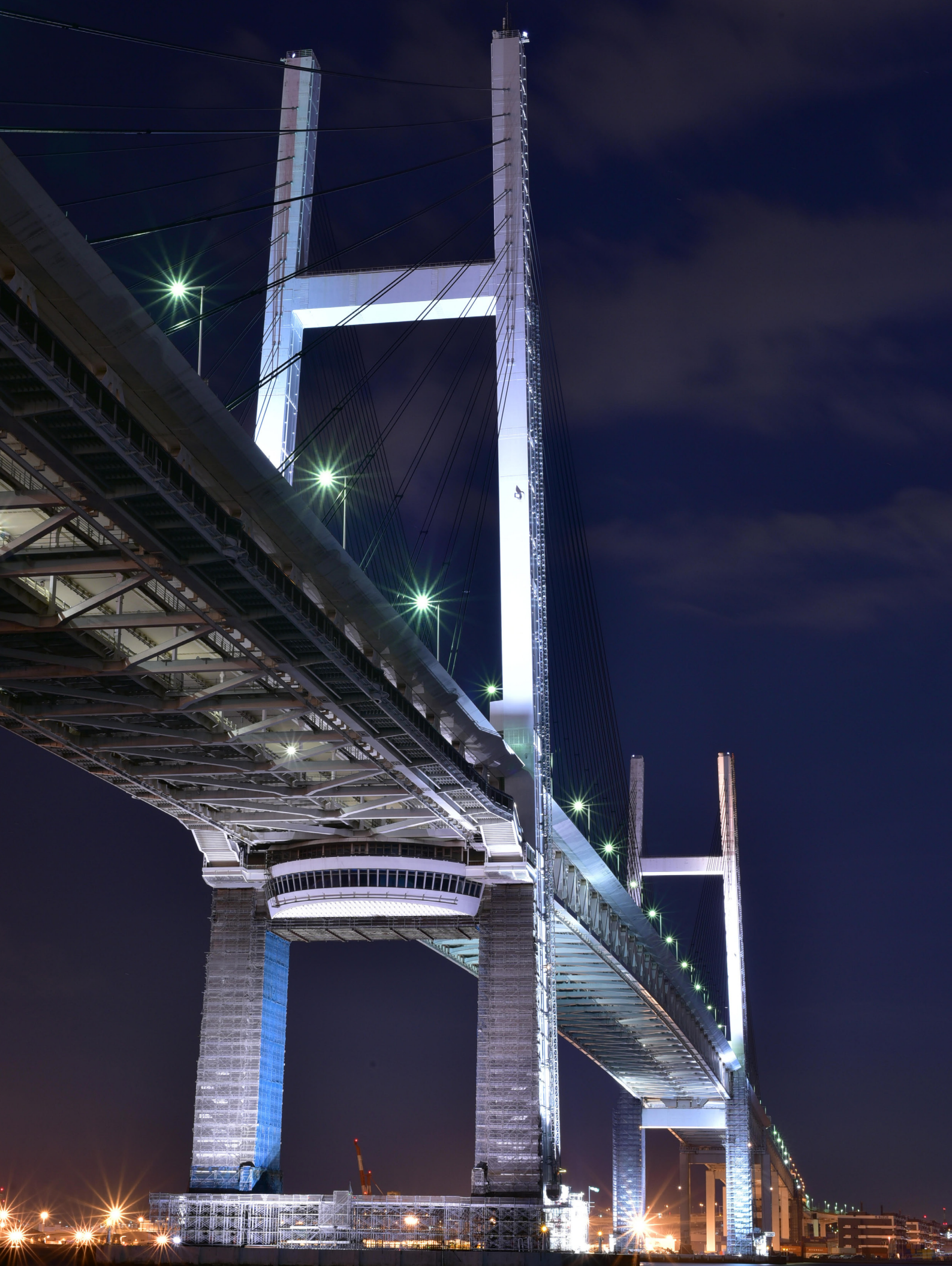
中区、鶴見区 横浜ベイブリッジ (みち・眺望スポット/眺める/誇らしい)