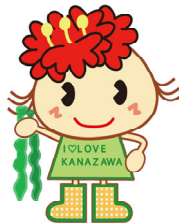
金沢区幸せお届け大使 ほたんちゃん

イベントでは、わかめの生育する様子や海洋生物が温室効果ガスを吸収することなどについて学び、“海育”を体験することができます！