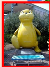
受付場所：シーパラシー太モニュメント