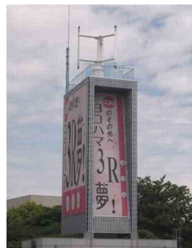
「資源循環局港北事務所 風力発電設備」