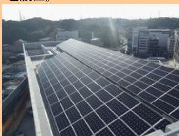
「戸塚区庁舎・太陽光発電設備」