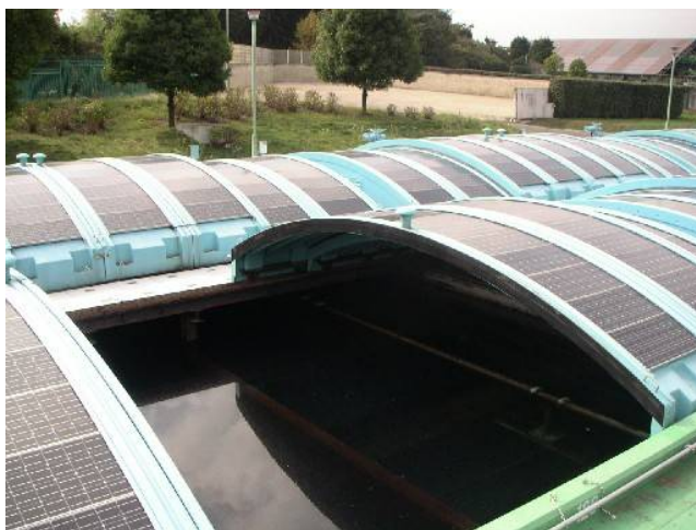
「小雀浄水場ろ過池・ ろくがい 覆蓋型太陽光発電設備」

公共施設に設置した太陽光発電、水道管路内を流れる水の力を利用した小水力発電、下水汚泥の処理工程で発生する消化ガスを活用した発電など再生可能エネルギーの活用を進めます。