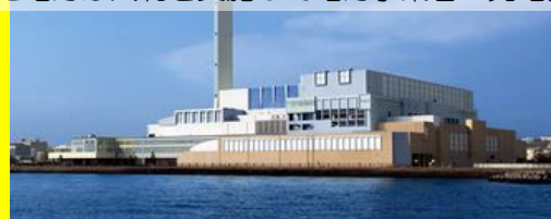
「資源循環局・金沢工場」

ごみを焼却して発生した熱エネルギーを有効活用して発電。発電した電気は工場内で使用するとともに近隣施設に供給。さらに余った電力は入札を実施して電力事業者へ売電。