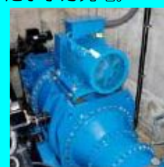
「水道局 川井浄水場発電設備」