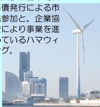
「環境創造局・ハマウイング」

住民参加型市場公募債発行による市民参加と、企業協賛により事業を進めているハマウイング。