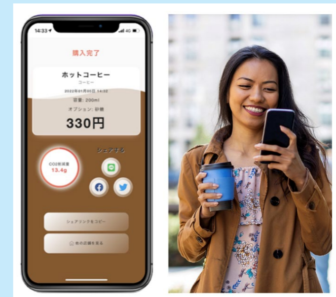
フィルズのアプリ利用イメージ