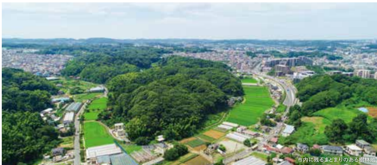
市内に残るまとまりのある樹林地

森(樹林地)の多様な役割や機能が発揮されるよう、 緑のネットワークの核となるまとまりのある森を重点的に保全するとともに、 保全した森を市民・事業者とともに育み、次世代に継承します。