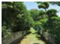
指定拡大区域： 樹林地へ至る通路