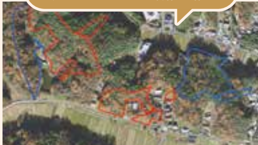
既指定樹林地に隣接する樹林地の指定