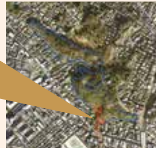
既指定樹林地のきめ細やかな指定