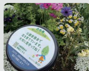
公園花壇での現地表示プレートの設置