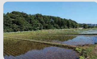
水田の保全(戸塚区)

市内の水田面積の約9割を保全し、農地縁辺部の草刈りや植栽等により良好な農景観を維持・形成しました。