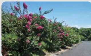
農地縁辺部への植栽(金沢区)