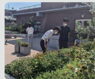
港北区庁舎(港北区)