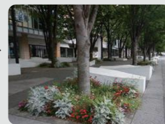
グランモール公園(西区)

多くの市民が集まる都心部の公共空間などで、緑や花による空間演出を集中的に展開し、街の魅力の向上、賑わいづくりを進めています。