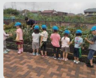
農園付公園(瀬谷区)