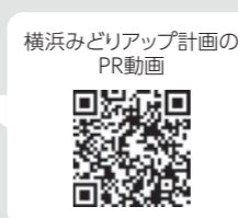
横浜みどりアップ計画のPR動画