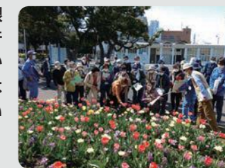
市民連携花壇講座(中区)

山下公園で市民参加の球根ミックス花壇の講習会を行うとともに、市内の1,000か所を超える公園で市民による花壇づくりを展開しています。