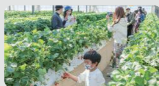
収穫体験農園(神奈川区)