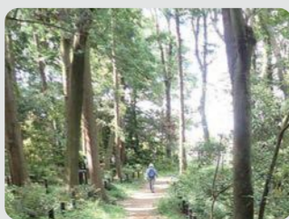
上川井市民の森(旭区)