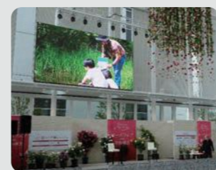
横浜市役所アトリウムでのPR動画放映