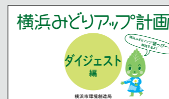
計画を解説するアニメーションをSNSで発信