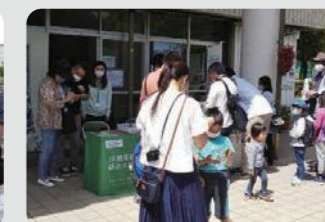
緑や花を身近に感じる各区の取組(鶴見区)