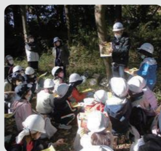
森づくり活動団体への支援(磯子区)

保全した市管理の樹林地を良好かつ安全に維持管理するとともに、森づくり活動団体に対する支援や、民有樹林地所有者に対する維持管理費用の一部助成を行いました。