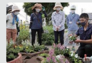
地域の花いっぱいにつながる取組(栄区)

オープンガーデンなどの市民が緑や花に親しむ取組を各区で推進しました。併せて、取組の成果をガーデンネックレス横浜の中で発信し、市民や地域・企業等の関心の高まりへとつなげました。