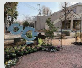
小学校の花壇整備(南区)