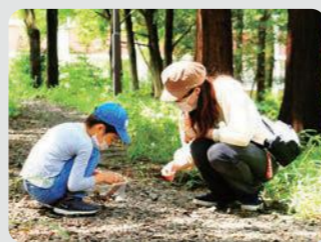
よこはま森の楽校(緑区)

コロナ禍で身近な自然にふれあうニーズが高まる中、外出の機会が減った子どもたちが参加できる自然の中でのびのびと過ごす森のイベントを多く開催しました。