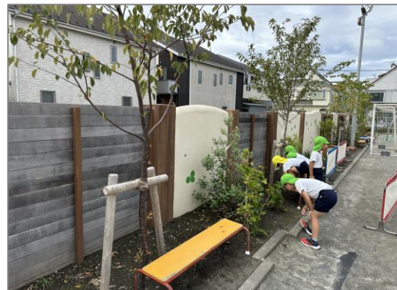
㉓ 幼稚園での緑の創出・育成 (区内幼稚園)