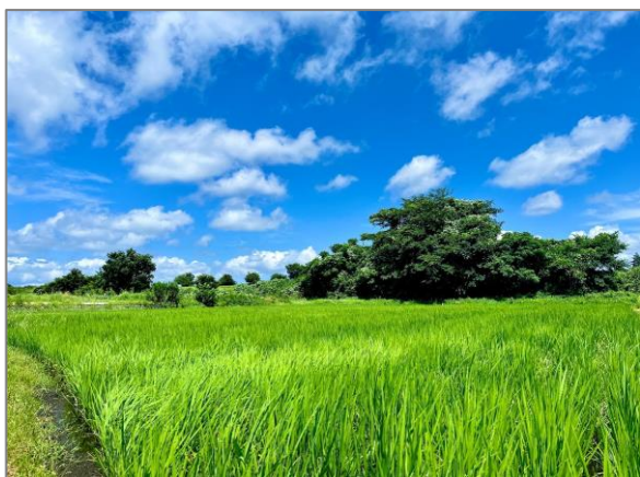
⑧ 水田の保全 (瀬谷町)