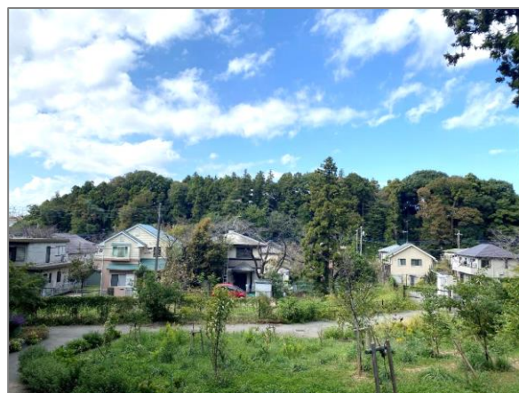
① 緑地保全制度による新規指定 (下瀬谷二丁目特別緑地保全地区)