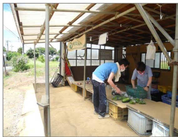
⑭ 青空市・マルシェ等 (上瀬谷直売所グループ)