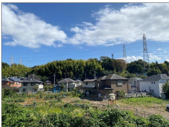
① 緑地保全制度による新規指定 (阿久和南一丁目特別緑地保全地区)