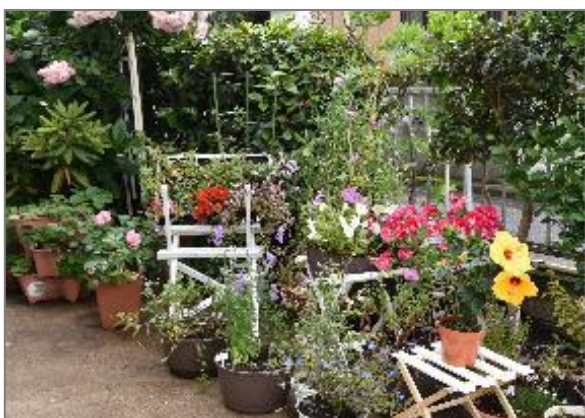
⑳ 地域に根差した緑や花の楽しみづくり (オープンガーデン)