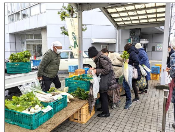
14 青空市・マルシェ等 （港北支店 朝市）