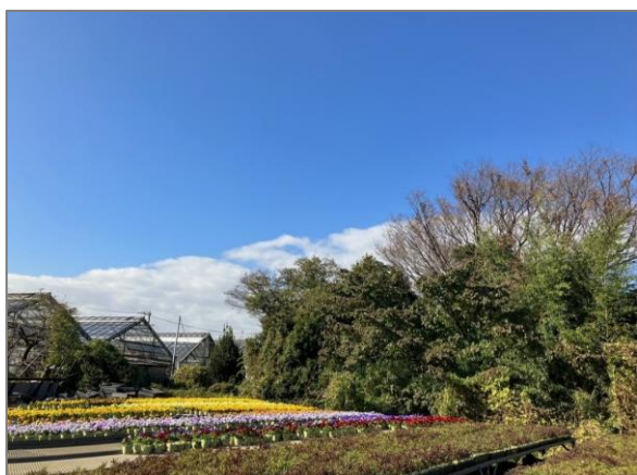
1 緑地保全制度による新規指定 緑地保存地区（小机町）