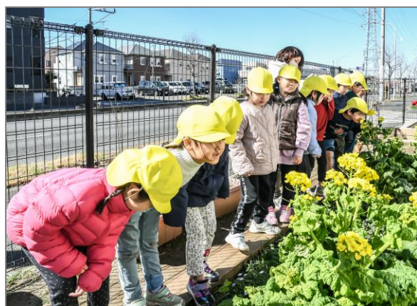
25 保育園での緑の創出・育成 （区内保育園）