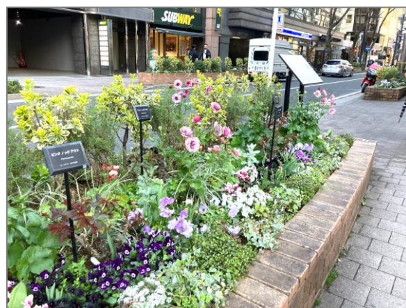
26 都心臨海部等の緑花による魅力ある空間づくり （新横浜駅周辺）