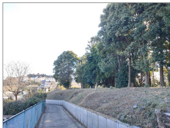
3 樹林地の維持管理の助成 （鳥山町）