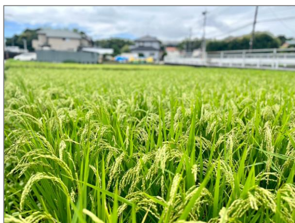
8 水田の保全 （新羽町）