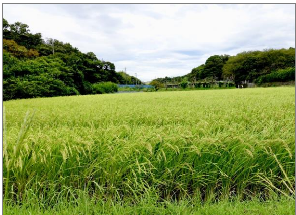
8 水田の保全 (野庭町)