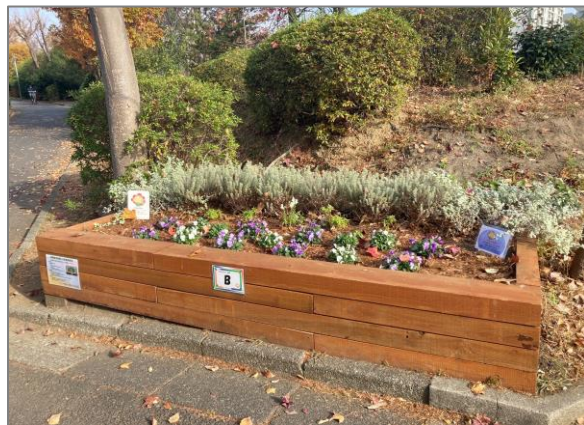
22 地域緑のまちづくり (野庭団地地区)