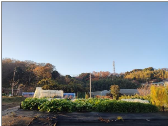
1 緑地保全制度による新規指定 (野庭・上永谷町特別緑地保全地区)