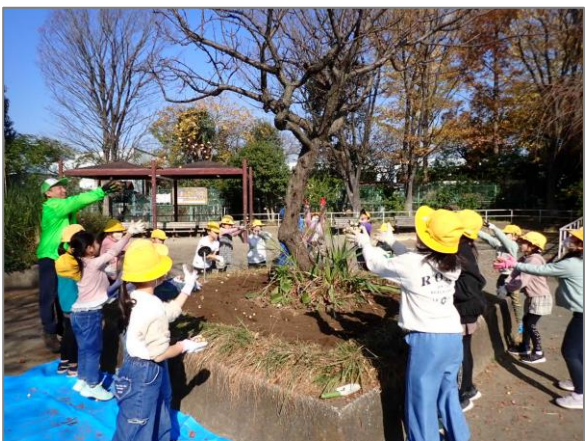
23 地域に根差した緑や花の楽しみづくり (みなみが丘公園)