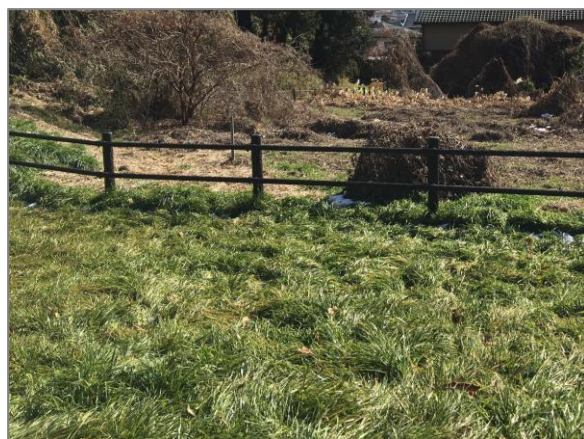
2 森の維持管理 (下永谷市民の森)