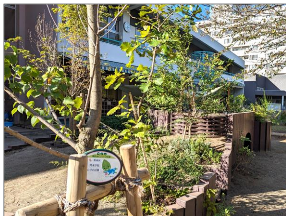
25 保育園での緑の創出・育成 (区内保育園)