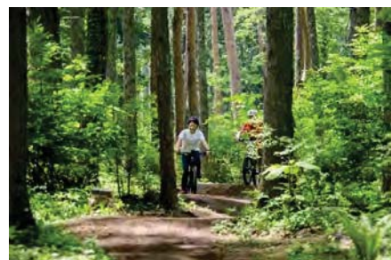
トレイルアドベンチャー コースイメージ

フォレストアドベンチャー・よこはまが設置されている樹林地内に、緩やかな傾斜でのアップダウンやコーナーなどを配置し、MTB（マウンテンバイク）、E-MTB（電動アシスト機能つきMTB）、E-BIKE（電動モーターバイク）、トレイルランニング等、様々なアクティビティを上級者から初心者、お子様から大人まで気軽に楽しめる森の中の多目的なコース(=トレイル)です(有料、別紙参照)。