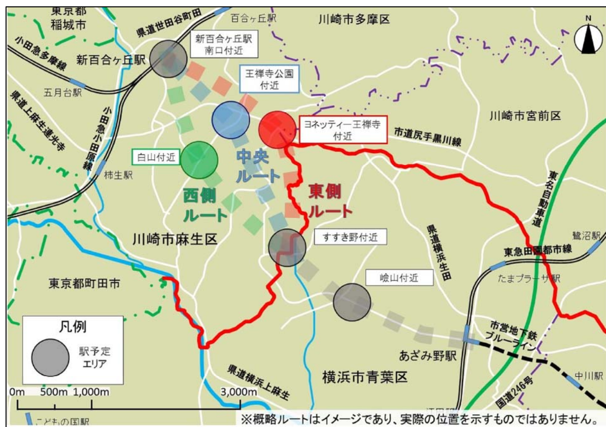
図 概略ルート・駅位置案