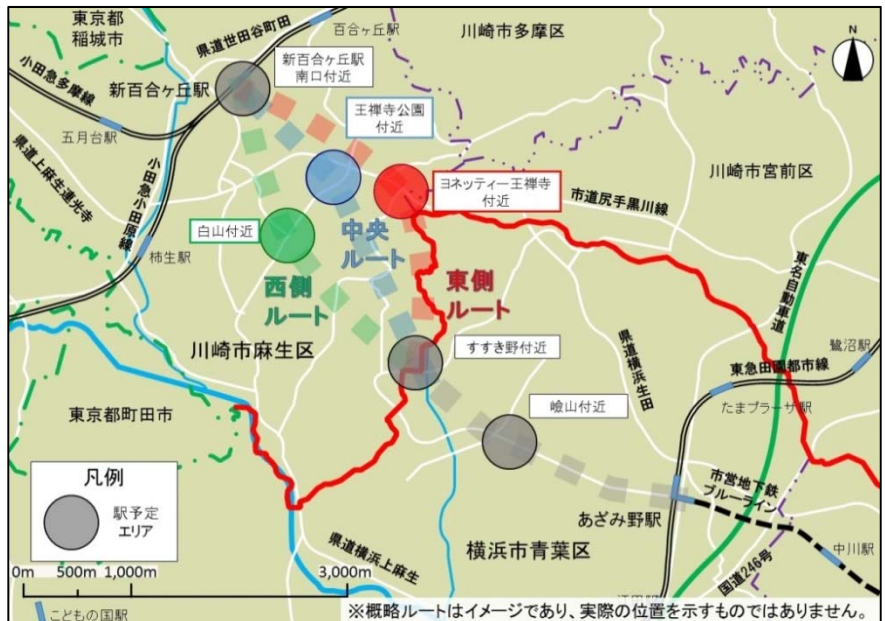
■概略ルート・駅位置図

※概略ルート3案について、総合的に評価した結果、「東側ルート」を、より整備効果が高い有カルート案と考えています。