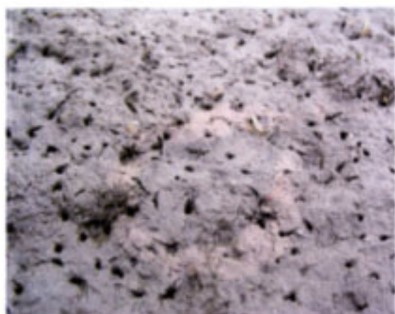
カワゴカイ類の巣穴(干潟中央部付近) 占種