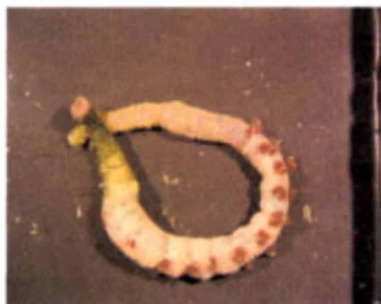
タマシキゴカイ (実体顕微鏡撮影 x10)