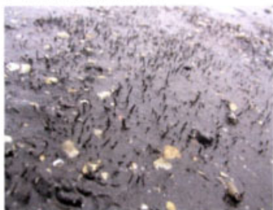
スピオゴカイ群集(棲管が密集している)