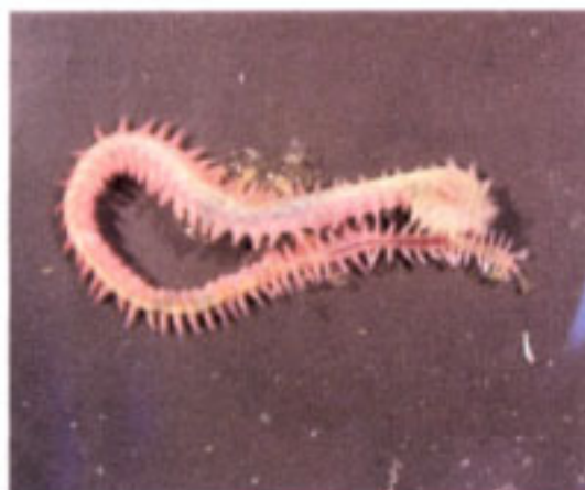
掘り出たヤマトカワゴカイ Hediste diadroma 優