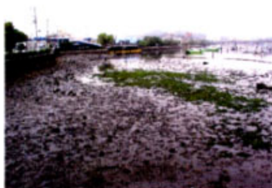
海岸動物（干潟）調査 夕照橋干潟調査地点