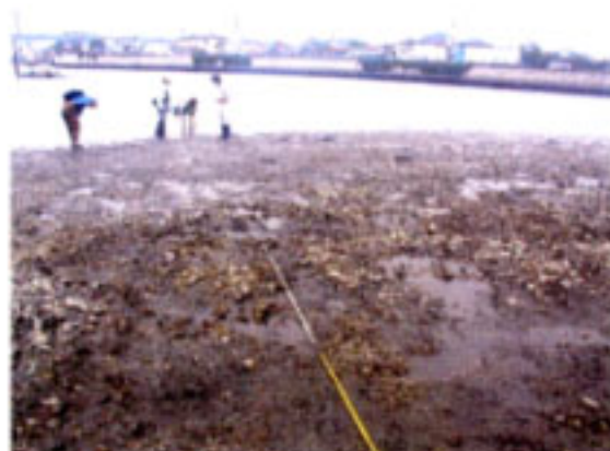
目視観察 ベルトトランゼクト調査