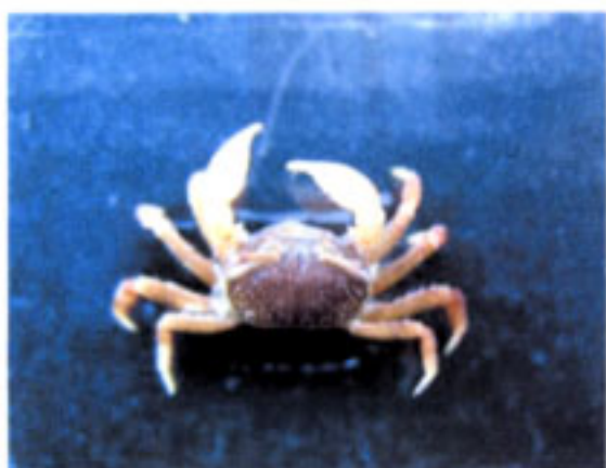
巣穴から採取されたチゴガニ