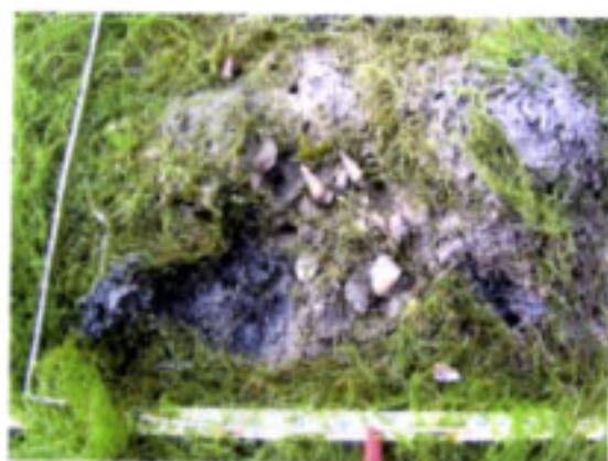
その下の様子 ホソウミニナ、アサリ、シオフキガイが生息