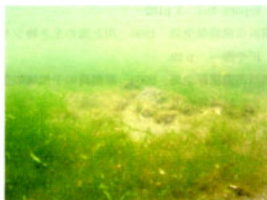
干潟前面海底の状況 アオサ、アオノリ類、