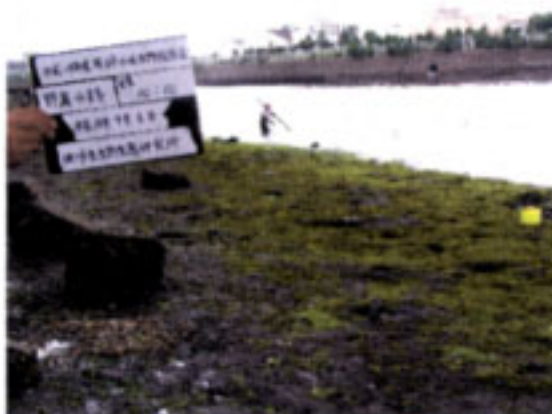
海岸動物（干潟）調査 野島水路干潟調査地点（平潟湾方向） 野島海岸方向