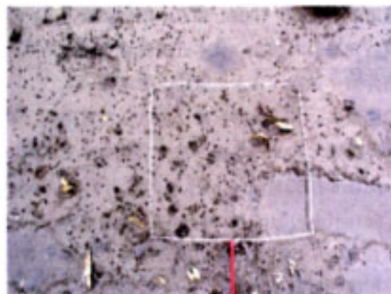
干潟中央部（護岸から 30m 付近）枠は 30 cm