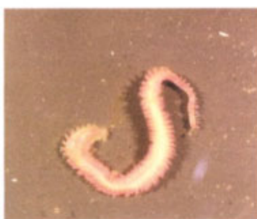
コケゴカイ (優占種)