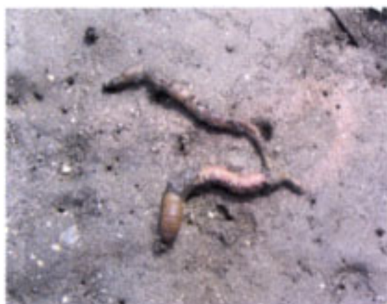
糞塊を掘り、採取されたタマシキゴカイ