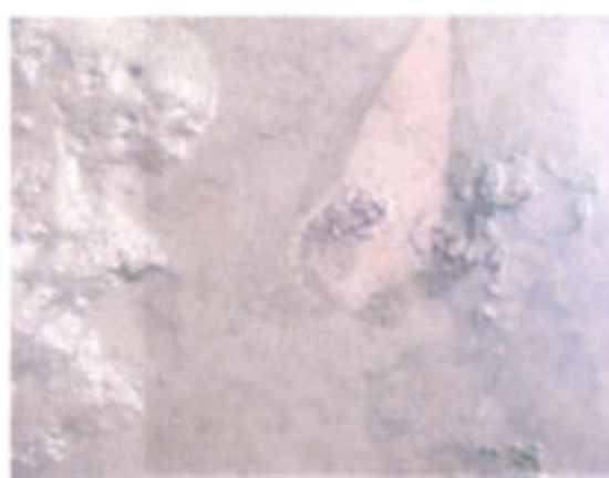
タマシキゴカイの糞塊(トグロ状のもの)