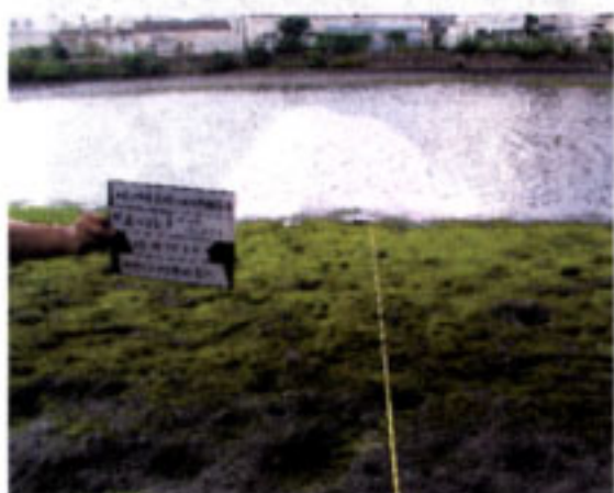
ベルトトランゼクト調査