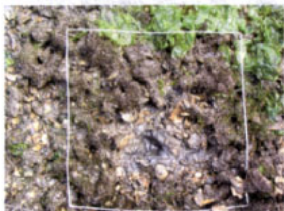
マガキ群集内(枠は 30cm)マガキが密集し、礁を形作る。貝殻にはアオノリ類、アオサ類、ホトトギスガイなどが付着する。