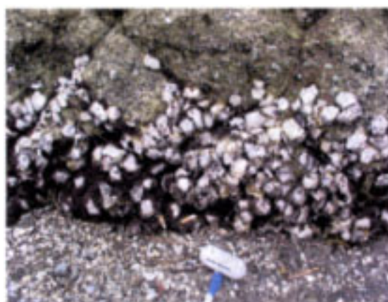
石積み護岸 マガキ群集