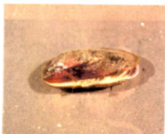
コウロエンカワヒバリガイ