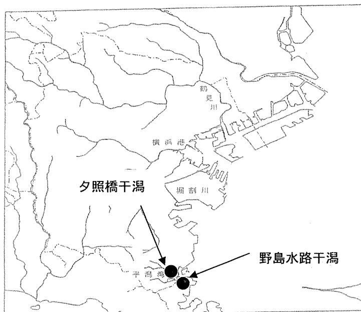
図-4.1 平潟湾における海岸動物（干潟）調査地点図

平潟湾における調査は平潟湾干潟域の生物相調査の一環として、侍従川河口干潟、鷹取川河口干潟、野島水路野島側干潟および野島水路横須賀市側干潟の4地点において1997年より7年間連続して行われた。今回調査は、4地点の中から夕照橋侍従川河口干潟および野島水路野島側干潟の2地点において実施した。調査地点を図-4.1及び地点の詳細を図-4.2に示す。既往の調査では、四季に年4回程度の周年調査が行われているが、今回の調査では、5月29日および9月6～7日の2回/年で実施した。