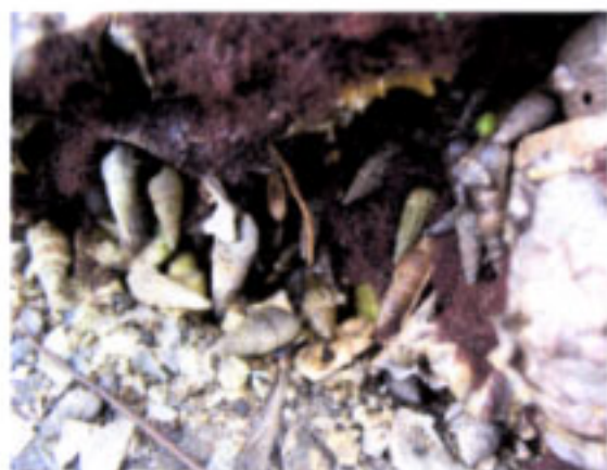
ホソウミニナ、ヤドカリ類など