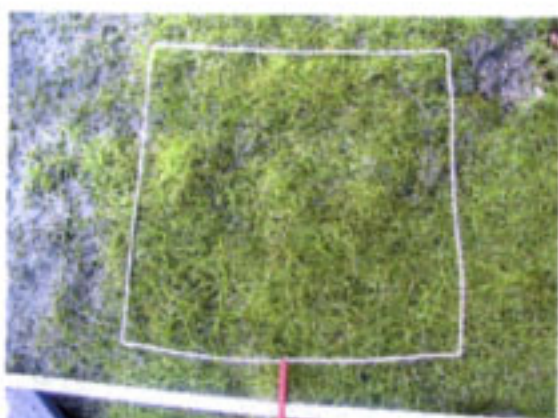
スジアオノリが繁茂 (9月調査) キガイが生息