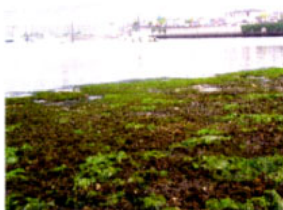
カキ礁（護岸から 50m 付近） マガキ群集 ゴカイ類の棲管などみえる。