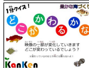
1分クイズ!どこがかわるかな