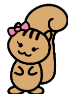
環境リス子ちゃん

横浜市環境創造局環境管理課 横浜市中区本町6-50-10 電話：045-671-2487 FAX：045-681-2790 Eメール：ks-kagaku@city.yokohama.jp ホームページ：https://www.city.yokohama.lg.jp/kurashi/machizukuri-kankyo/kankyohozen/hozentorikumij/kagaku.html