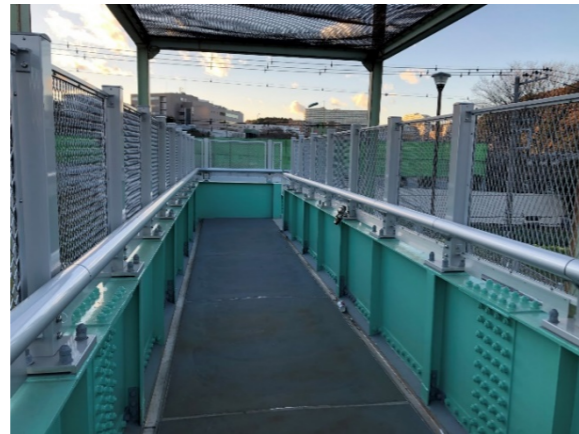
補修工事後 (イメージ)