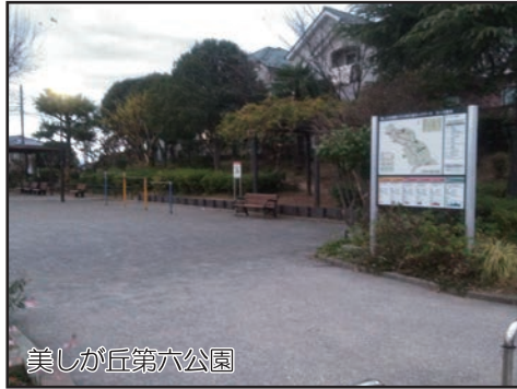
美しが丘第六公園