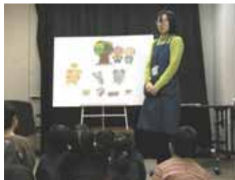
定例おはなし会 (神奈川図書館)