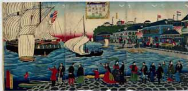
収蔵資料「横浜波止場ヨリ海岸通異人館之真図」三代広重、明治期

開港期から明治期の図書約1,500冊、横浜浮世絵約400枚、絵地図約180枚、横浜絵葉書や震災・復興を記録した絵葉書約3,000枚などを収蔵しています。