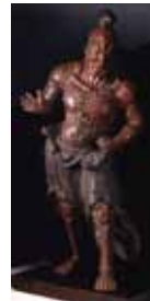
〔弘明寺〕 木造金剛 力士立像