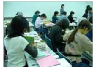
図書修理講座(平成 18 年度)より