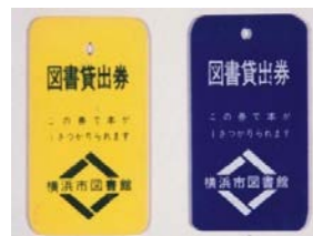
トークン(移動図書館で使用)