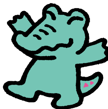
鶴見区マスコット ワックン

そうした課題解決につながるような読書活動に関する講座・イベント等の開催や、資料・情報の収集・提供協力を通し、人と人とのつながりづくりを促進します。