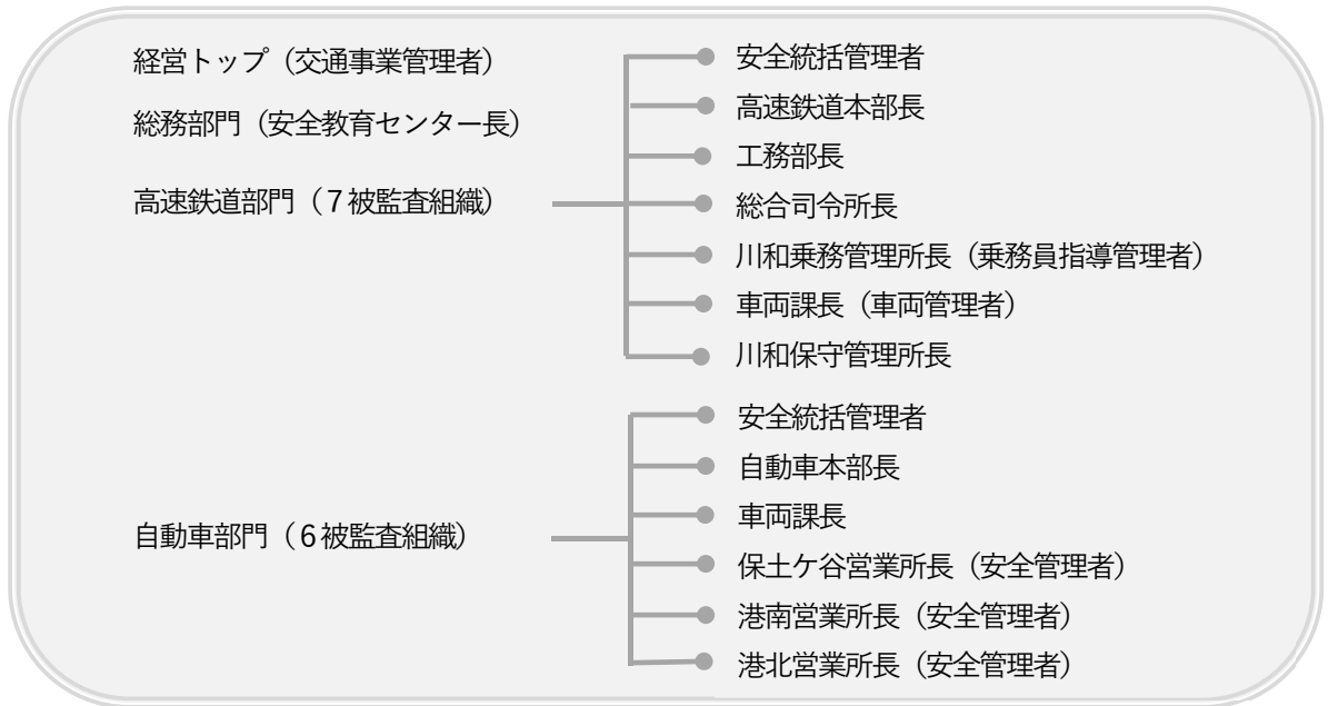
※令和5年度内部監査結果（令和5年7月～10月実施）