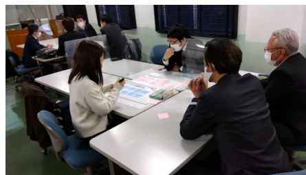
▲安全研修(グループワーク)の様子

研修では、重大事故について感じたことや、安全に対する思い、自分の職場でのリスクなどについてグループ討議を行っています。