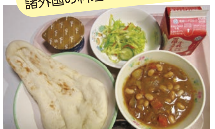
ナン、牛乳、カレービーンズシチュー、フレンチサラダ、アイスクリーム