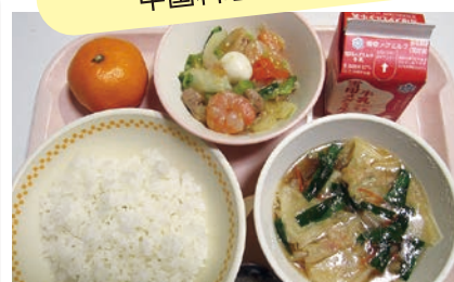
ごはん、牛乳、中華丼の具、ワンタンスープ、みかん