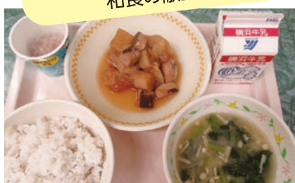
麦ごはん、牛乳、ぶりだいこんみそ汁、納豆