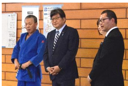
部活動指導員の活動の視察