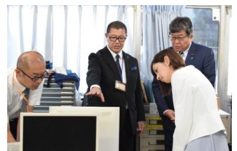
試行導入の欠席連絡システム ※ の紹介