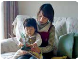
協力:横浜子育てサポートシステム・提供会員