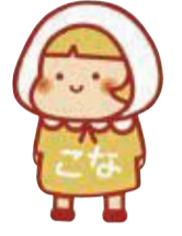
横浜市地域福祉保健計画 推進キャラクター ちぶくちゃんの港南区版 「こなちゃん」

障がいや認知症、自分が暮らしている地域のことなど、まず「知る」ことから、誰かと「つながる」きっかけに。あいさつなど「できることをやる」ことから、近所で「支えあう」一歩に。4つのアクションの矢印は、それぞれが相互につながっていることを示しています。