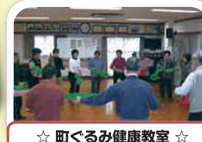
☆ 町ぐるみ健康教室 ☆