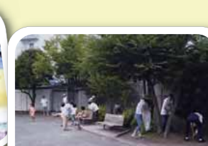
☆ おはよう清掃 ☆

みんなで協力し合い、地域を盛り上げています。 さまざまな活動で、地域のつながりが生まれています。