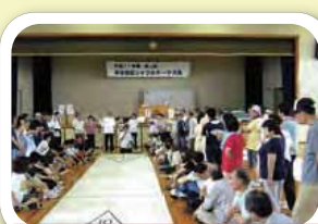
☆ シャフルボード大会 ☆