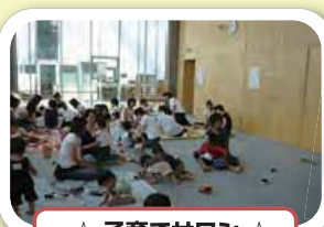
☆ 子育てサロン ☆