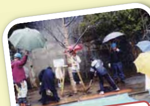
☆ 桜の木の植樹 ☆