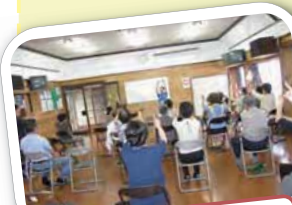
☆ セリがや健康塾 ☆