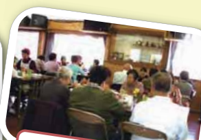
☆ 高齢者給食会 ☆