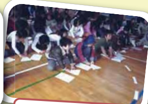
☆ 紙飛行機大会 ☆