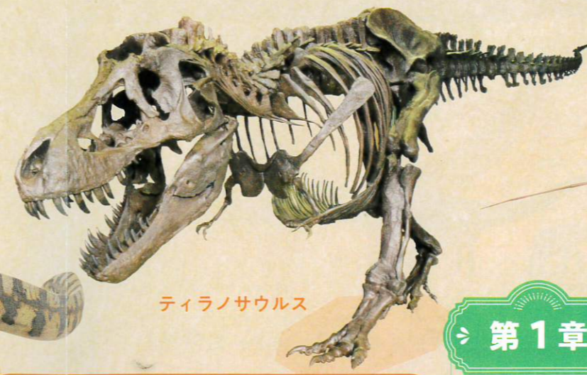
ティラノサウルス

全長13mに達するティラノサウルスも、祖先をたどると原始的な種では2mほどしかなかった?! この章では、様々な恐竜の進化をたどります!