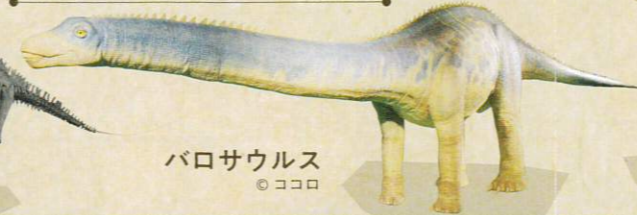
パロサウルス ©ココロ