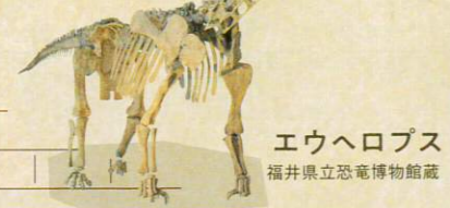
エウヘロプス 福井県立恐竜博物館蔵