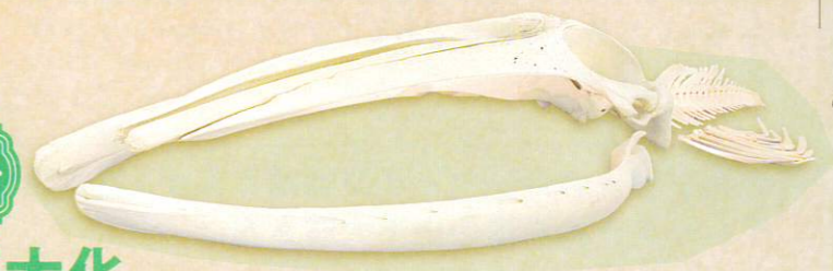
ナガスクジラ 福井県立恐竜博物館蔵

いま生きている動物から絶滅動物まで、「巨大な」生き物が集合! 生物はどのように巨大化したのか、なぜ大きくなる必要があったのかを考えましょう。