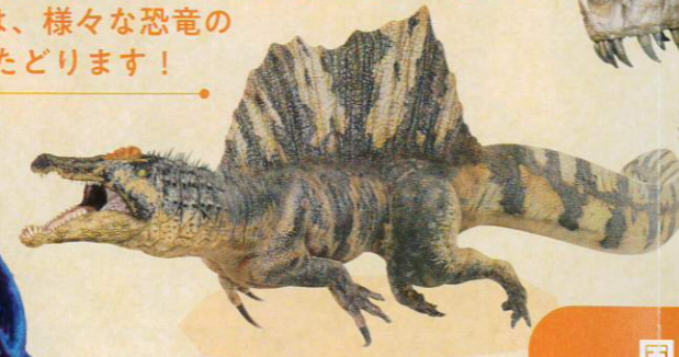
スピノサウルス