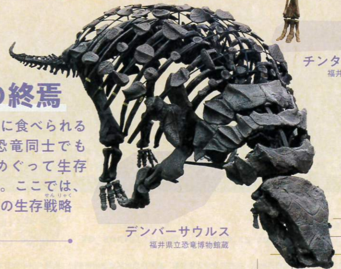
デンバーサウルス 福井県立恐竜博物館蔵

草食恐竜は肉食恐竜に食べられるだけでなく、草食恐竜同士でもエサとなる植物をめぐる生存競争にさらされます。ここでは、様々な草食恐竜たちの生存戦略を紹介します。