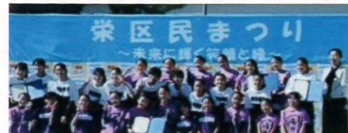
【栄区子ども青少年スポーツ・文化活動表彰】を受賞

<今後の活動> ADDICT vol.7「全チーム合同発表会」が決定!! 2025.4.5(土)関内ホール(大ホール)にて