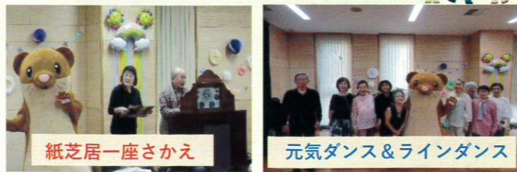
紙芝居一座さかえ