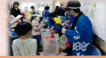
ボランティアさん 大活躍！