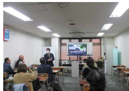
シルバードライビングスクール