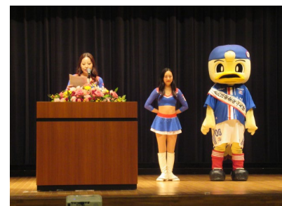
交通安全宣言・防犯決意表明