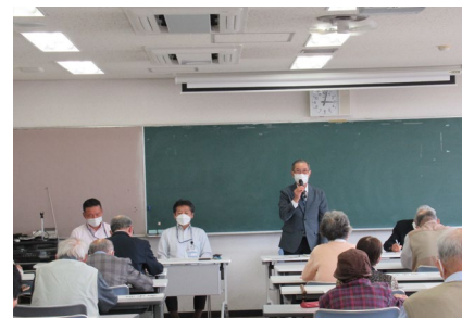
シルバーリーダー総会

5 月 26 日、港北区役所会議室にて港北区交通安全シルバーリーダー連絡協議会総会を開催し、会員 114 名中 43 名が出席、37 名から委任状を提出いただき、過半数をもって可決されました。