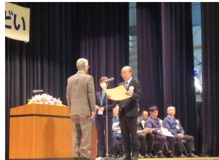
ポスターコンクール入賞者表彰