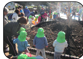
球根投げ植え風景