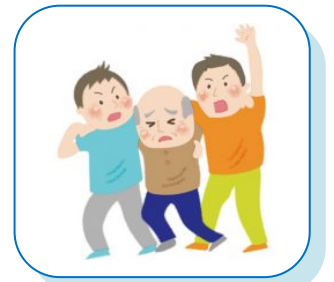
災害に備えた 要支援者の把握