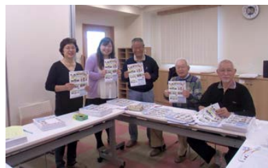
イベント カレンダー 発行