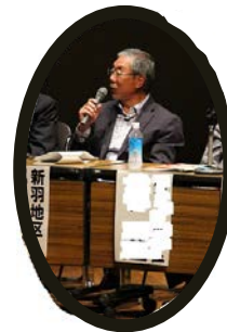
区民フォーラムで 発表