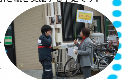
さがしてネット訓練の様子

「新吉田やすらぎ塾」は、塾生の・塾生による・塾生のための企画に取り組み、地域の皆さんがつながる機会をともに作っていきたくと考えています。