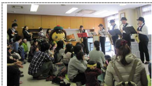
たかたん♥こどもまつり

自治会町内会や活動団体、高田にある施設などがそれぞれに活動を充実し、協力しながら少しずつ取り組みを進めていきます。高田に住む多くの方に、地域のイベントや活動に参加してもらい、活気あるまちにしていきたいと思っています。