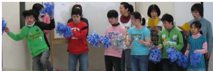
障がい児音楽グループ