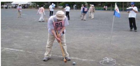
グランドゴルフ大会