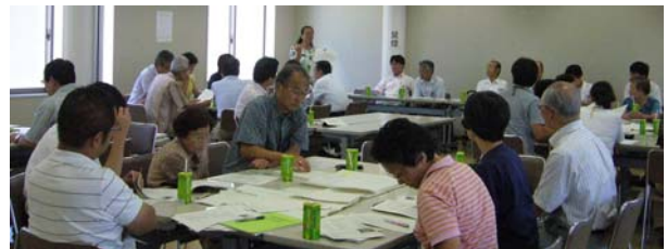
ひっとプラン港北 地区別計画策定委員会