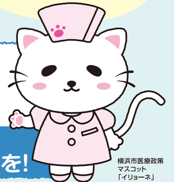
横浜市医療政策マスコット「イリョーネ」