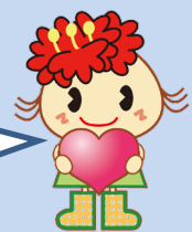
金沢区幸せお届け大使 「ぼたんちゃん」