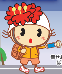
金沢区 幸せお届け大使 ぼたんちゃん