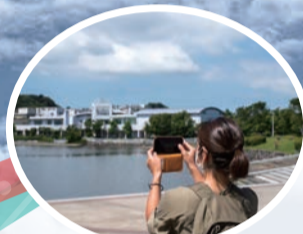
【団体】 ヨコハマママナビ