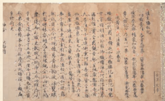
往生講私記 鎌倉時代 大阪青山歴史文学博物館蔵

写真は金沢文庫印をもつ『往生講私記』という仏書です。永観(一〇三三〜一一二二)が撰述した『往生講式』の鎌倉時代の古写本です。現在、金沢文庫印の捺された仏書は数点が知られているのみであり、本書はこれまであまり知られていなかった金沢文庫本として注目されるもので、金沢文庫印の謎を解明するひとつの手がかりになるかもしれません。