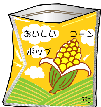
お菓子の袋（プラスチック製）