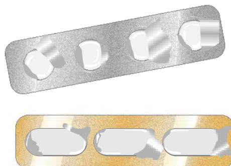
薬（飲み薬錠剤）の個別包装ケース