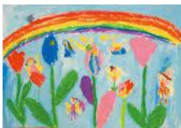
捜真小2年 サマラコン ミヌキさん