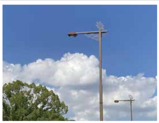
(撮影地:神奈川小近くの国道沿い)