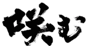
映画タイトルロゴ

脚本の製作の過程で、自分にとっての言語である手話で物語を紡ぐ事に挑戦しました。生まれつき耳が聞こえない私は、「書き言葉」は本などから学習できますが、「話し言葉」のような日本語の微妙なニュアンスを知ることが難しいです。よって日本語で考えて脚本を作るとどうしても硬い表現になったり、普段皆さんが使わない言い回しになったりすることがあります。そのために、手話で考えた内容を撮影して手話による