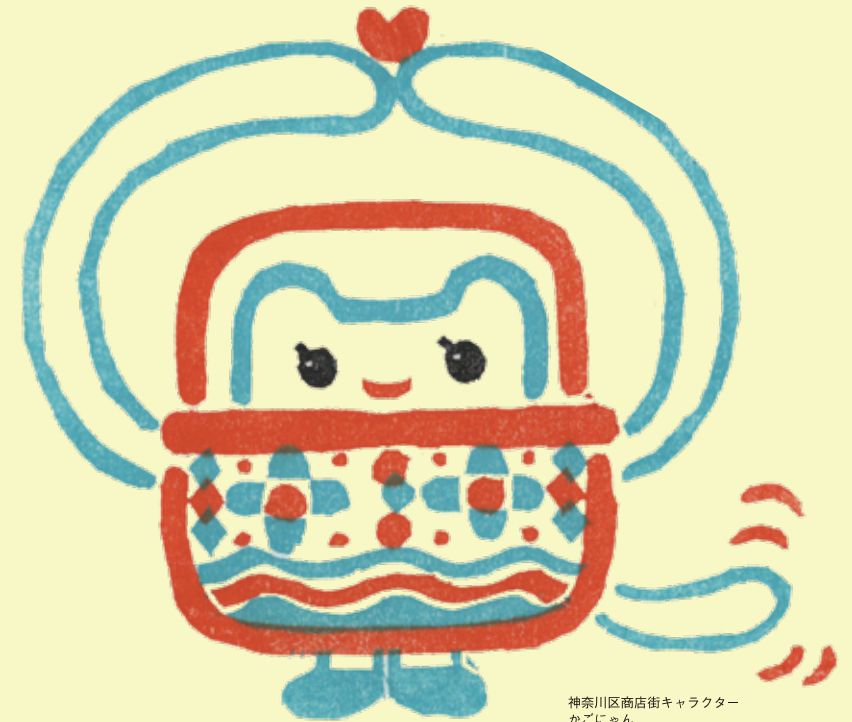
神奈川県商店街キャラクター かごにゃん

かものばいあこようせい 買い物かごに入っているネコの妖精。 このまちの人たちの思いやりが大好きで、 商店街に住んでいる。神奈川県と同年。 「少しのお小遣いでも、みんなと触れ合っ てエンジョイできるよ♪幸せ♡」とハートで伝 えている。