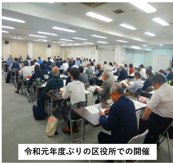
令和元年度ぶりの区役所での開催