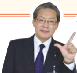
磯子区長 猪俣 宏幸