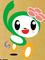
磯子区 マスコットキャラクター 「いそび」