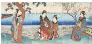
武州杉田の梅林 (神奈川県立歴史博物館所蔵)

※観光庁「地域の観光資源の磨き上げを通じた域内連携促進に向けた実証事業」として実施します。