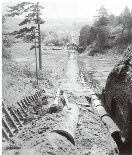
現東門から見た西谷浄水場からの配水管敷設工事