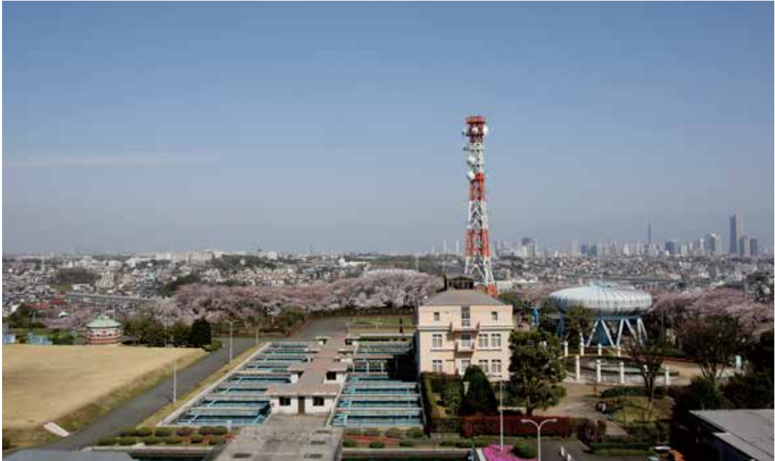
現在の西谷浄水場