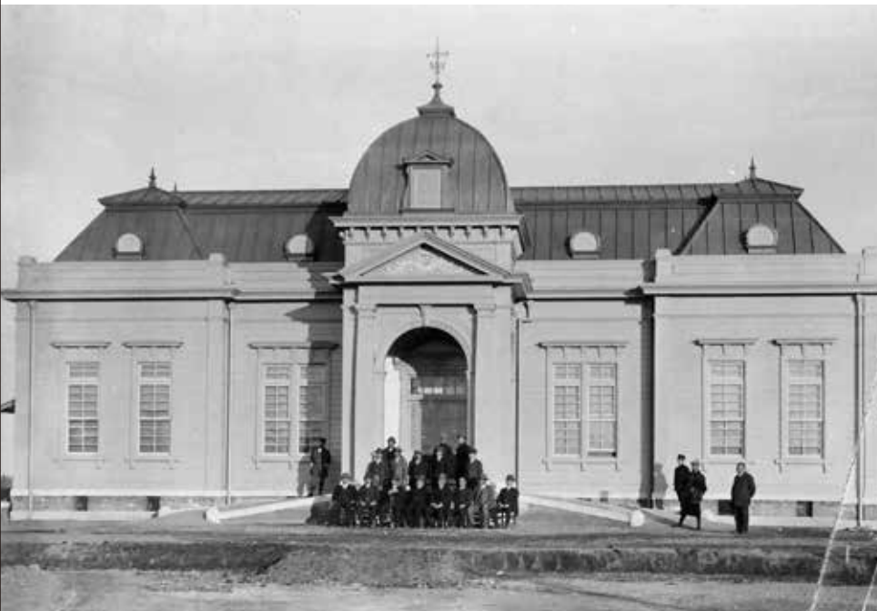
大正4年西谷浄水場 完成した事務所

明治20年（1887）、英国人技師パーマー氏の指導により、わが国初の近代水道として給水を開始した。大正4年（1915）に西谷浄水場が完成し、当時のレンガ造りの建築物は、平成9年に「国登録文化財」として登録されている。