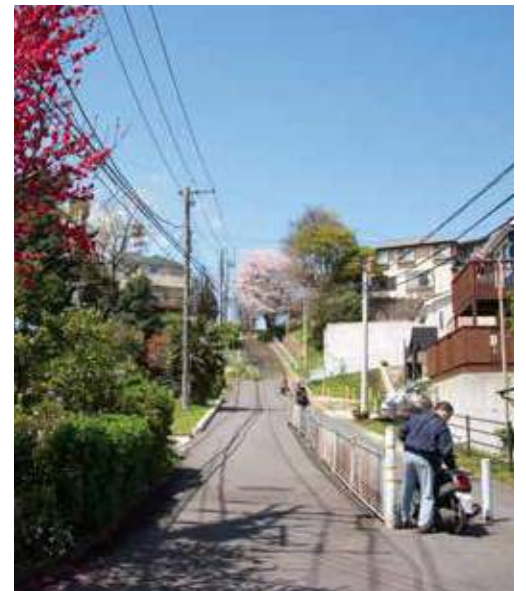
地域からは、50階段とも呼ばれている。 水道道