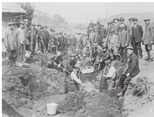
大正3年頃 仏向和田町間36インチ管敷設工事