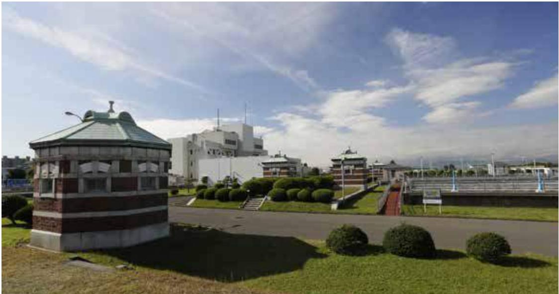
現在の西谷浄水場