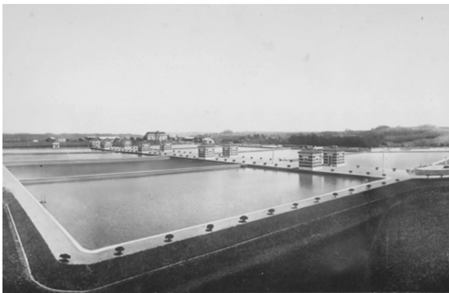
昭和7年 西谷浄水場