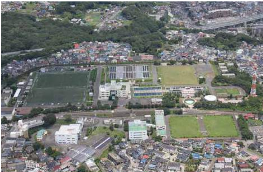
現在の西谷浄水場(空撮) 平成29年(2017)撮影