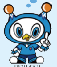
横浜FC オフィシャルクラブ マスコット フリ丸