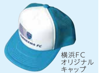
横浜FC オリジナル キャップ

コンプリート賞 クイズの答えから応援メッセージを導き出した人全員に オリジナルマスクをプレゼント!