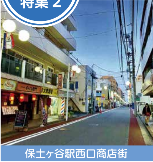
保土ヶ谷駅西口商店街