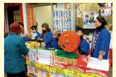
多くの人参加した 2019年歳末福引イベント

「お客様も、区内の商店街も、広く世間全体も、皆が良くなっていけるよう、区商連に加盟している商店街の声、特に若い人のアイデアを丁寧に聞きながら、希望を持って会長としての活動を行っていきたく」と、区商連への思いを熱く話してくれました。