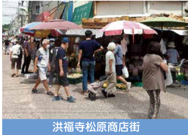
洪福寺松原商店街