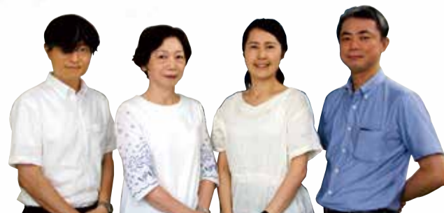
生活支援係の職員