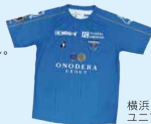
横浜FC ユニフォーム