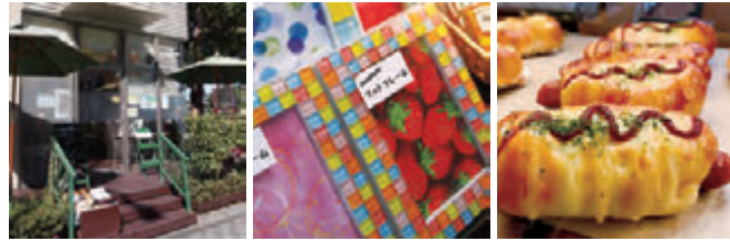
Smile Garden Hodogaya