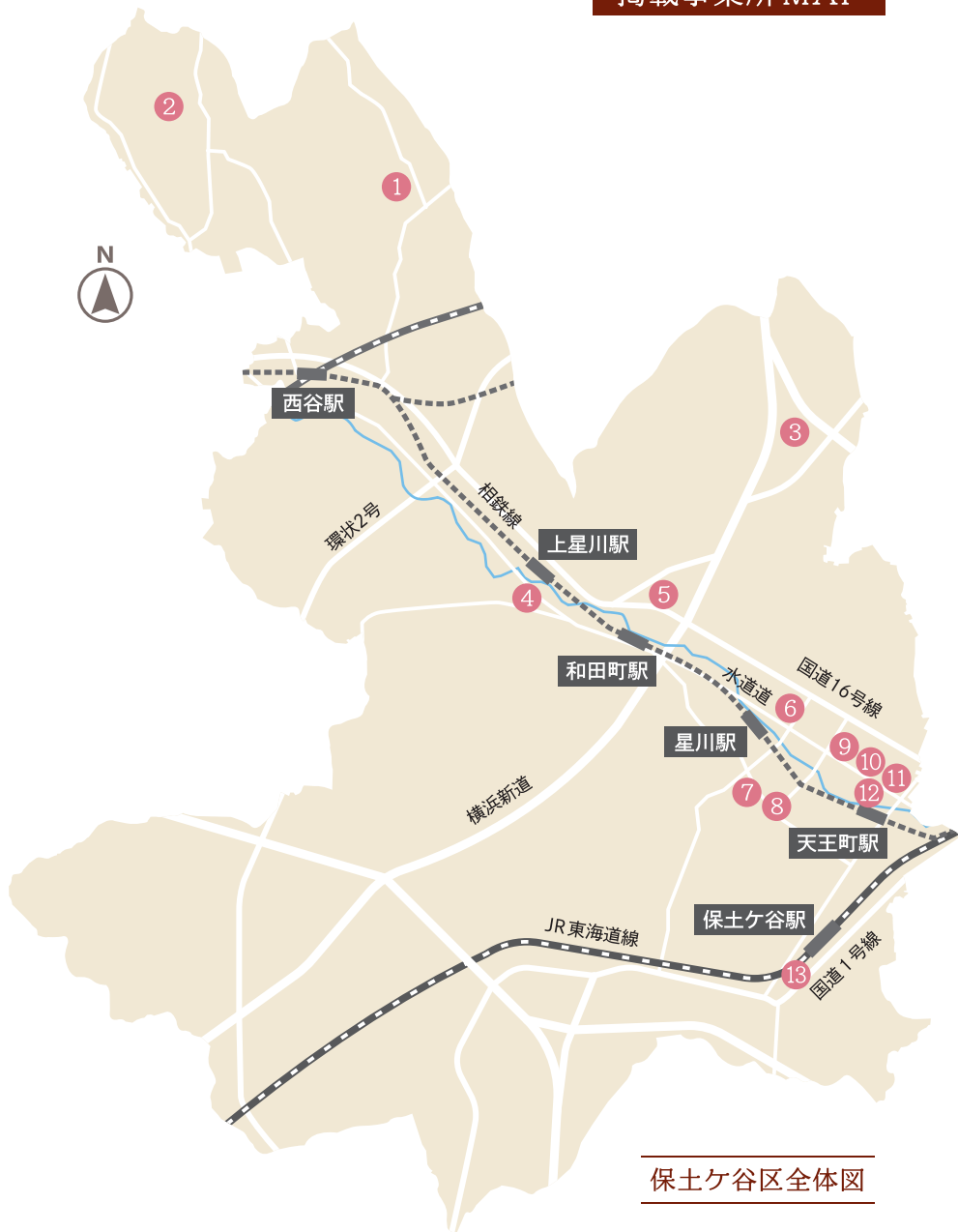
保土ヶ谷区全体図