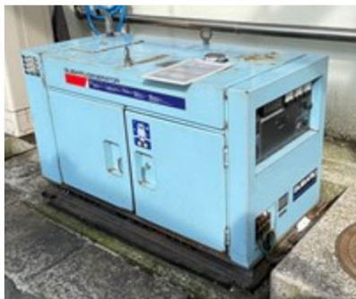
(写真：当該設備全体)