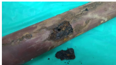
【劣化による埋設配管の損傷部分】