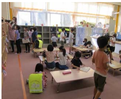
【放課後キッズクラブの活動】