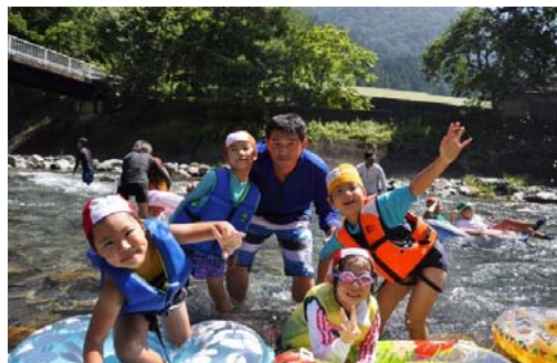
【放課後児童クラブの課外活動】

クラブにおいて地域や民間事業者等と連携したイベントやプログラムが実施できるよう支援を行います。